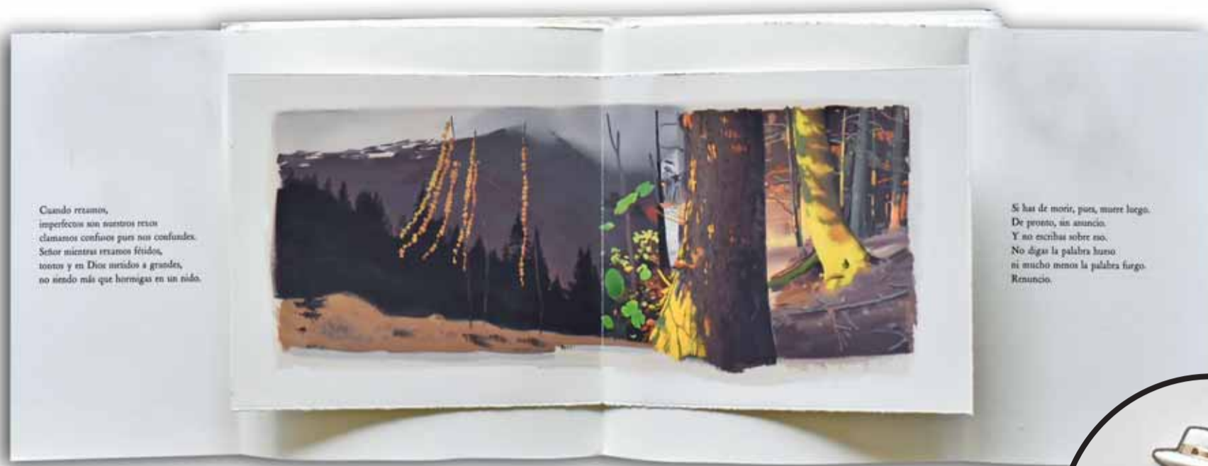
"Dice en su corazón el insensato", de Uribe, inspiró notables pinturas de Nils Udo, autor de land art .