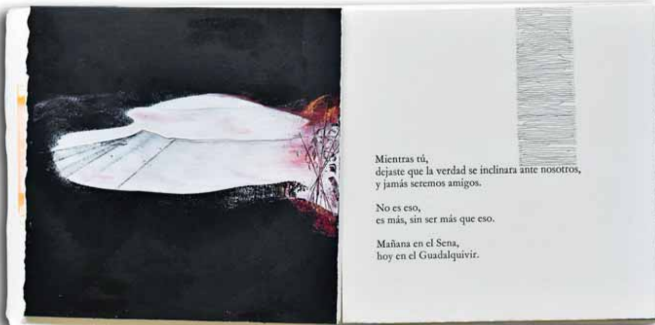
La visualidad del poema "Contra-Día", de Ximena Godoy, impulsó una sugerente y misteriosa obra del artista Brien Wood, quien ha expuesto en el MoMA y trabaja con pintura, dibujo, grabado y fotografía. La poeta participaba en tertulias de poesía, en París, con Gervais Jassud

les, quienes han realizado (otros están en ello) trabajos que van desde una pintura figurativa, pasando por un vigoroso neoespressionismo y hasta un minimalismo. Entre las miradas plásticas destaca la propuesta sólida y genuina del canadiense Brien Wood (1948), quien vive en Nueva York, ha expuesto en el MoMA y hace pintura, fotografía, dibujo y grabado. La seductora obra visual que acompaña el poema es por momentos más figurativa y en otros se vuelve casi abstracta. Es sugerente y misteriosa.